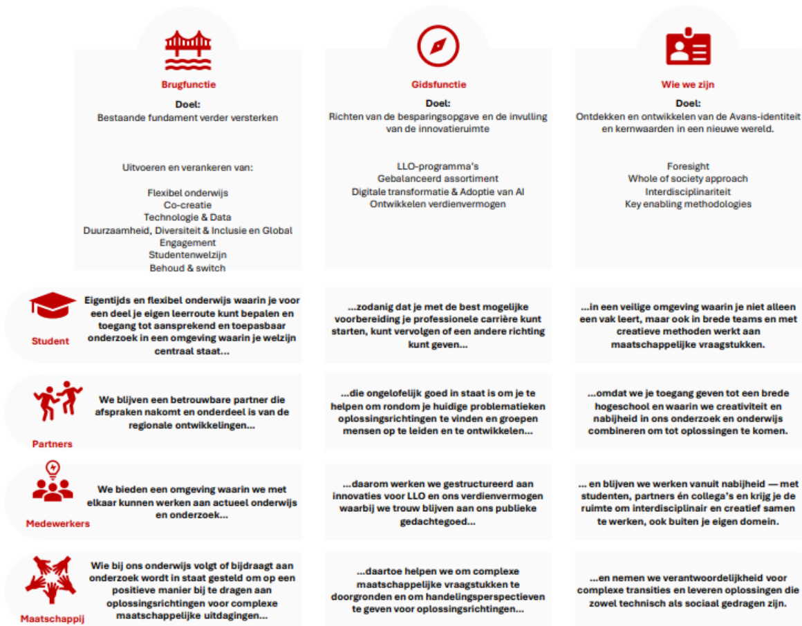
Figuur 1: hoe wij waarmaken wat we beloven