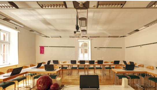
Seminarraum Schlossleiten | 80 m 2