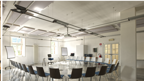
Seminarraum St. Jakob | 108 m 2