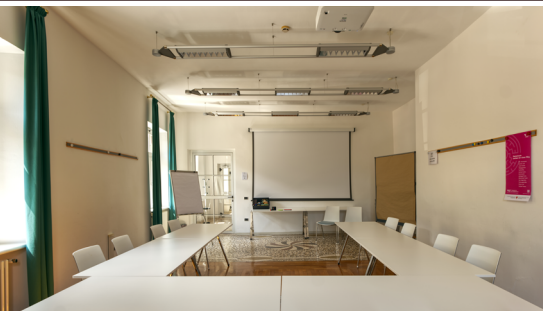
Seminarraum Kastelaz | 44 m 2

Sie suchen einen Rückzugsort, um in Kleingruppen zu arbeiten? Für das Selbststudium? Für kreatives Gestalten? Inspirierende Nischen und Plätze finden Sie drinnen und draußen.