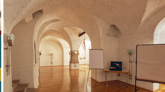
Hobbyraum | 167 m 2

Sie suchen einen Rückzugsort, um in Kleingruppen zu arbeiten? Für das Selbststudium? Für kreatives Gestalten? Inspirierende Nischen und Plätze finden Sie drinnen und draußen.