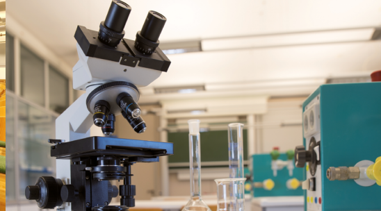
Labor | 61 m 2