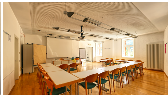
Seminarraum Maratsch | 65 m 2

Moderne Kommunikationstechnik steht kostenlos zur Verfügung: Glasfaseranschluss, WLAN, Videokonferenzsystem für hybride Veranstaltungen, Mikrofone, Audioanlage, Laptops, Tablets, Beamer. Ebenso kostenfrei stehen Flip-Chart, Pinnwände, Moderationskoffer für Sie bereit. Unser Team begleitet Sie – organisatorisch und technisch.