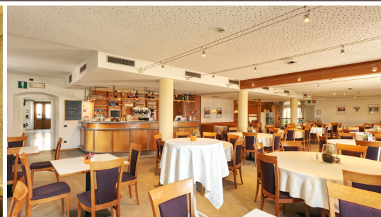
Bar mit Restaurant