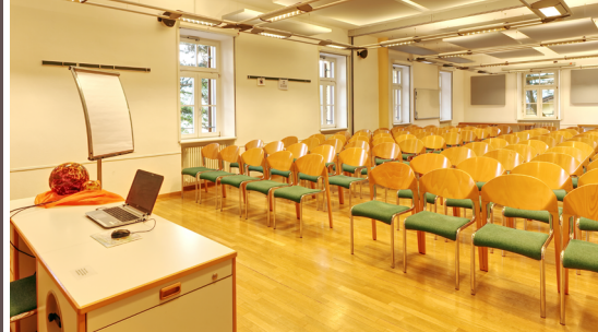
Seminarraum Leuchtenburg | 113 m 2