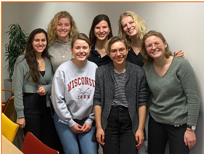
Van links naar rechts:

Wij zijn de nieuwe HAMLETT stagiaires van het UMC Utrecht. De komende maanden lopen wij stage bij het HAMLETT onderzoek. Met een achtergrond in de neurowetenschappen, zullen onze scripties zich gaan richten op verschillen en veranderingen in het brein.