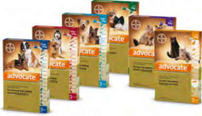
주성분 Imidacloprid (이미다클로프리드), Moxidectin (목시덱틴)