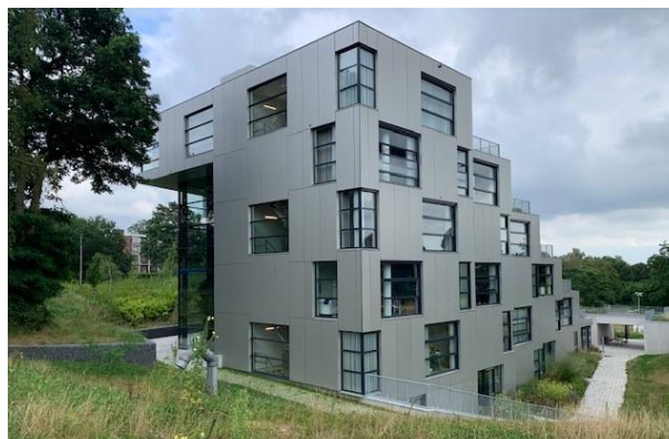
Aanzicht van Het Oosterveld 1 bij aankomst