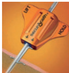
Figuur 3 Inwendige fixatie