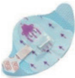
Figuur 2 Uitwendige Fixatie

De PICC wordt met een uitwendige fixatiepleister (figuur 2) of inwendig fixatie device gefixeerd (figuur 3). De PICC wordt afgedekt met een pleister die desinfecterende gel bevat. Deze pleister geeft gedurende een week een desinfecterend middel af om een infectie te voorkomen. Aan het begin van de PICC kunnen zich één, twee of drie toegangsmogelijkheden bevinden.