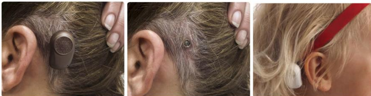
Beengeleider hoortoestel.