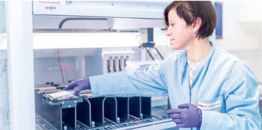
Typisierung der Gewebemerkmale mithilfe modernster Labortechnik.

Vorbereitungsphase. Dabei wird das erkrankte blutbildende System nochmal durch eine Chemotherapie und/oder eine Ganzkörperbestrahlung behandelt. Wenn dann die Einwilligung zur Spende widerrufen würde, hätte dies für die Patientin oder den Patienten schwerwiegende, ja sogar tödliche Folgen.