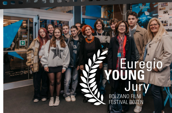
Euregio YOUNG Jury 2024

Il progetto è a cura del GECT - Gruppo europeo di cooperazione territoriale - Euroregione Tirolo - Alto Adige - Trentino e verrà organizzato dal Bolzano Film Festival in collaborazione con lo Jugenddienst Bozen.