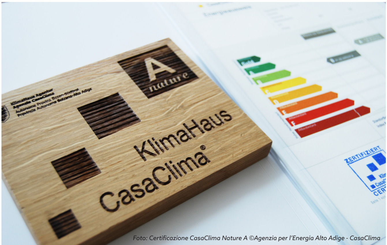
Foto: Certificazione CasaClima Nature A ©Agenzia per l'Energia Alto Adige - CasaClima