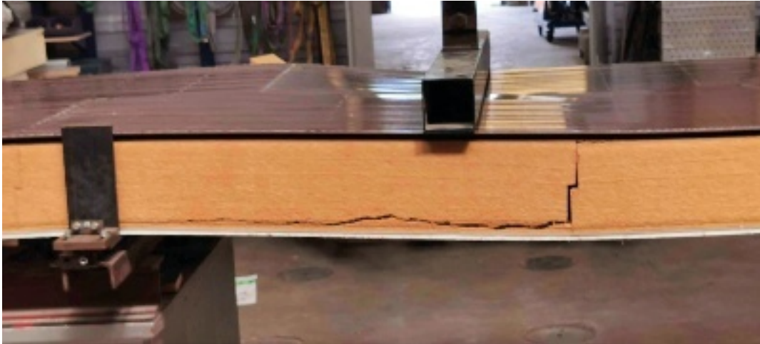
Essai mécanique de flexion sur un panneau

Grâce aux capacités de recyclage à l'infini de l'acier, les industriels du secteur proposent d'ores et déjà des produits d'enveloppe en acier décarboné issu d'une filière utilisant de l'électricité renouvelable (nombreuses FDES disponibles sur Inies).