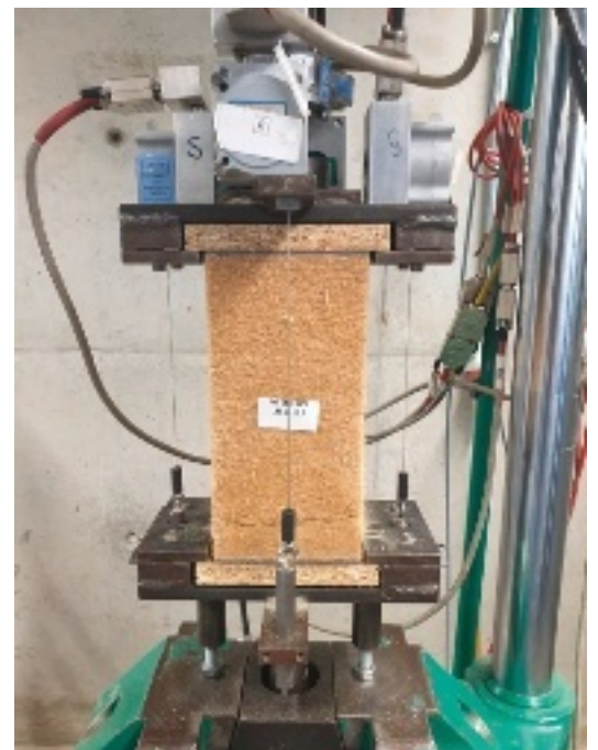
Essai de traction

25 % des travaux lourds ayant recours à des matériaux biosourcés ou bas-carbone. Parallèlement, les exigences de construction décarbonée sont de plus en plus sévères. Au 1 er janvier 2026, la RE2020 s'appliquera notamment à tous les bâtiments non résidentiels, notre cœur de métier. La filière de l'enveloppe acier du bâtiment doit donc pouvoir répondre à ces nouvelles obligations. Le tout sans impact sur les autres performances (mécanique, thermique, incendie, acoustique, etc...). Il faut qu'elle soit en mesure de proposer des procédés innovants aux performances validées par tierce partie indépendante.