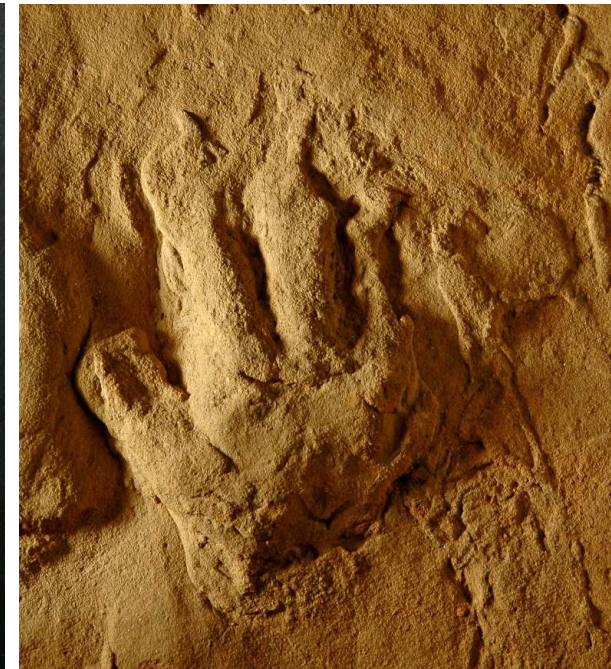
Pflanzenfossil Ortiseia ©Geoparc BletterbachSpurenfossil Tetrapodenfährte ©Geoparc Bletterbach