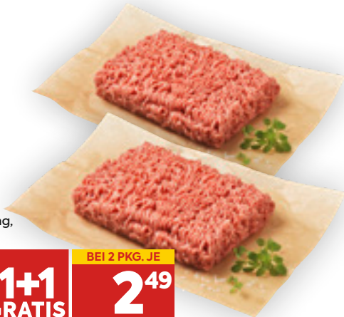
Hofstädter Faschiertes gemischt