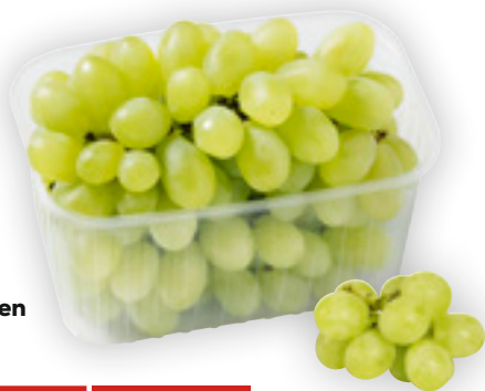
Fruchtige Trauben weiß »Italia« Kl. I, 1 Kilo Korb