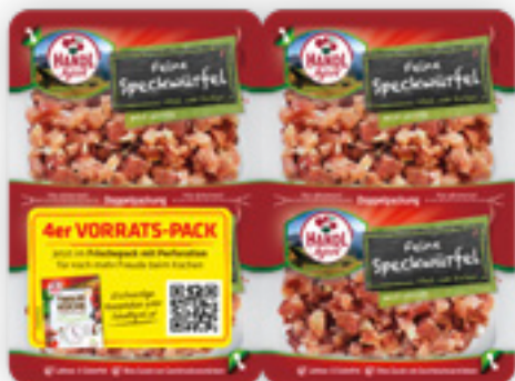
Handl Tyrol Feine Speckwürfel 300 g Packung (1 kg 19.97)