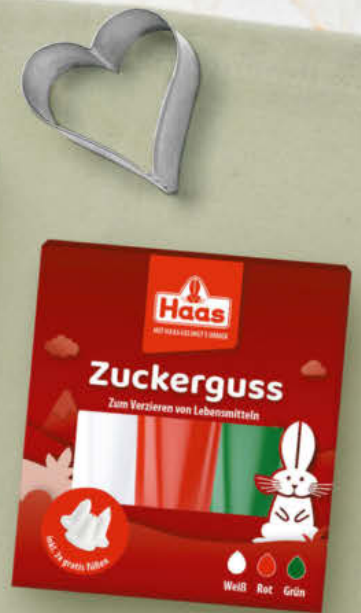
Haas Zuckerguss Rot-Grün-Weiß 150 g Packung (1 kg 23.93)