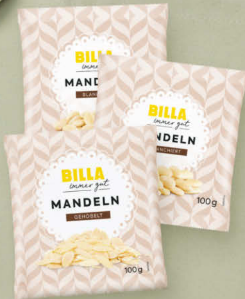
BILLA immer gut Mandeln blanchiert, gehobelt, gestiftelt od. ganz 100 g (1 kg 14.90)