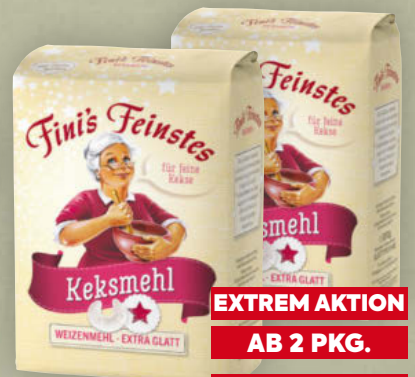
Fini's Feinstes Keks- od. Lebkuchenmehl 1 Kilo