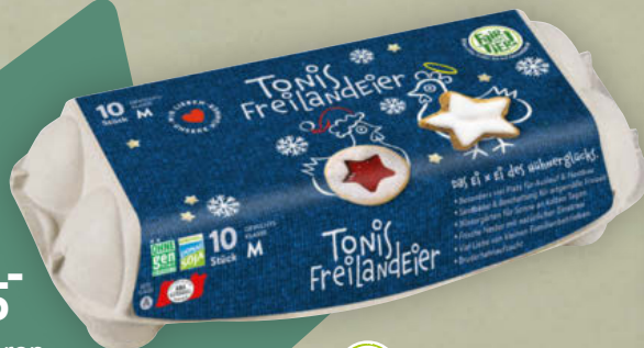
Tonis Freiland Eier Größe: M, 10 Stück Packung (1 Stk. 0.38)

Auch bei unseren »Fair zum Tier!«-Legehennen gilt artgemäße Haltung weit über die gesetzlichen Standards hinaus.