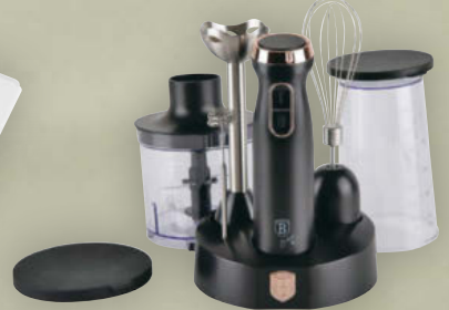
Berlingerhaus Stabmixer 6 in 1