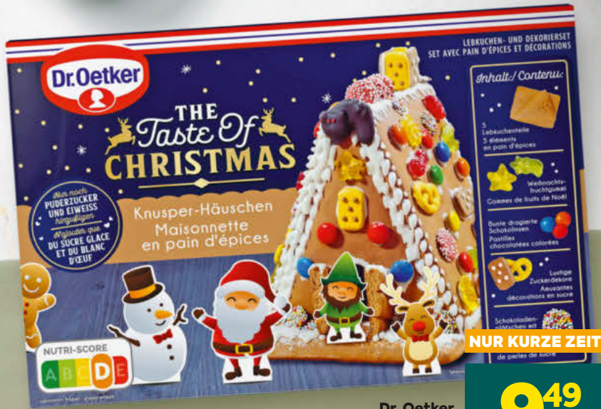
Dr. Oetker Knusperhäuschen 403 g Packung (1 kg 23.55)