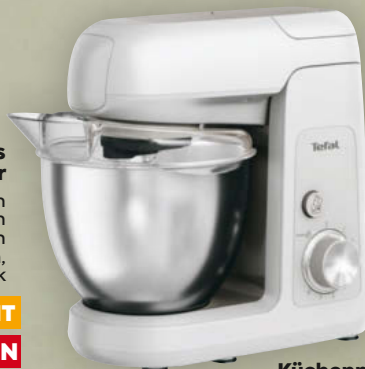
Tefal Küchenmaschine Bake Partner