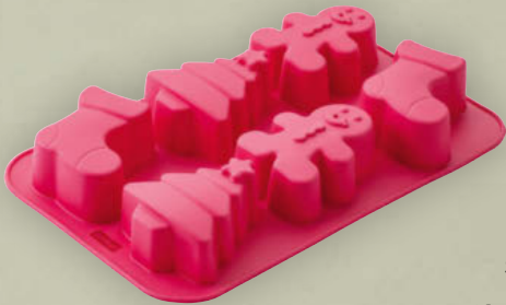
Zenker Silikon- Backform per Stück