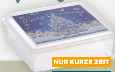
Miraplast Keks- od. Weihnachtsdosen div. Sorten 1,4–5 Liter, per Stück