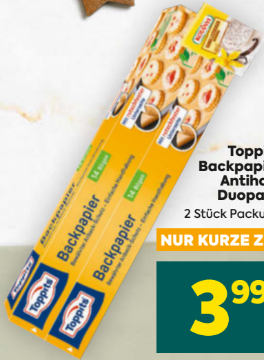
Toppits Backpapier Antihaft Duopack 2 Stück Packung