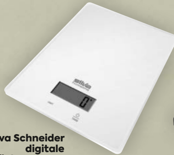
Silva Schneider digitale Glasküchenwaage