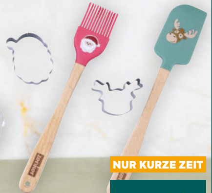
Zenker Teigschaber + Ausstecher per Stück