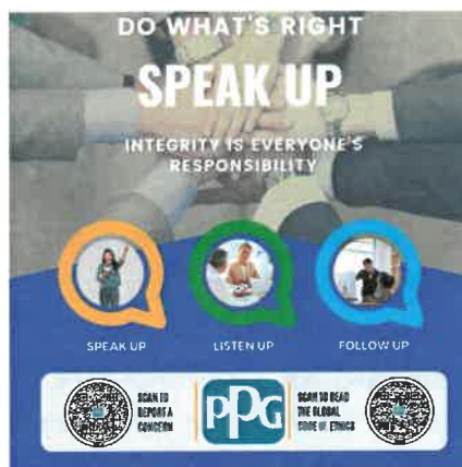
Speak Up Poster