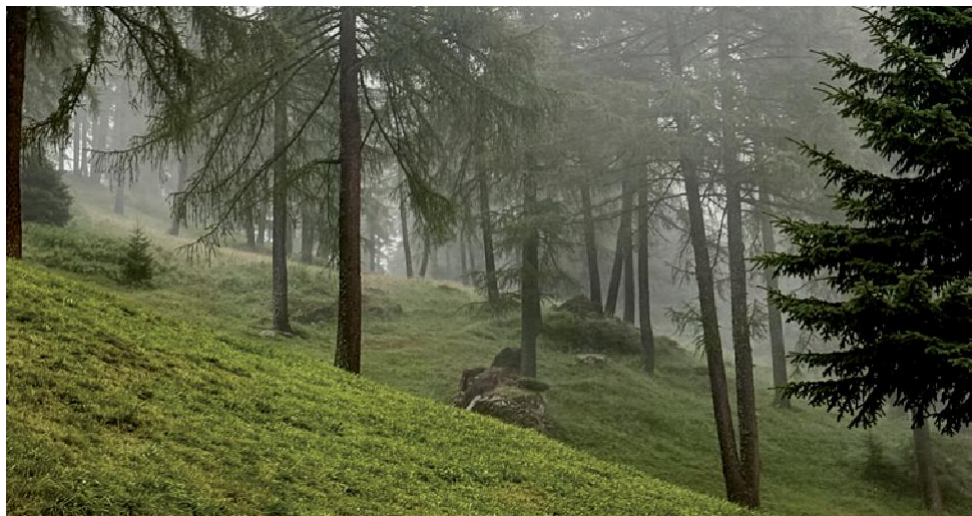
Questi prati e pascoli di larici sono stati identificati come boschi durante l'interpretazione delle immagini aeree e satellitari. La Stazione Forestale li ha verificati e classificati come prati con una quota di tara.

Nei prossimi mesi i confini delle superfici agricole nel Sistema informativo agricolo e forestale LAFIS saranno verificati e aggiornati su tutto il territorio della Provincia di Bolzano. I lavori saranno eseguiti dagli uffici competenti dei Dipartimenti Agricoltura e Servizio forestale. Il Dipartimento Servizio forestale si concentrerà soprattutto sulle superfici alpine mappate. Quasi tutte le aree alpine dell'Alto Adige devono essere elaborate. In parte, i rilevamenti avvengono anche direttamente in loco. In tale occasione vengono controllate anche le superfici a pascolo delle aziende che dispongono di aree alpine.