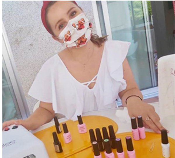
BEELD: ANA WEEINK

"Al sinds ik een pen kan vasthouden, teken en schilder ik. Door daarnaast tekenlessen en schildercursussen te volgen, leerde ik mezelf uit te dagen en 'out-of-the-box' te denken. Zo kwam ik ook tijdens de eindeloze zomervakanties, samen met een vriendinnetje en nictje, op het idee om mijn canvas te verruilen voor nagels."