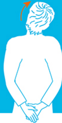
Trek je hoofd opzij

Deze oefeningen vormen een welkome afwisseling op je werk achter de computer of op zaal. Doe deze oefening ieder uur. Heb je het druk? Dan vaker!