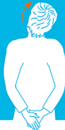
Trek je hoofd opzij

Deze oefeningen vormen een welkome afwisseling op je werk achter de computer of op zaal. Doe deze oefening ieder uur. Heb je het druk? Dan vaker!