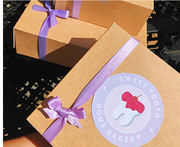
BEELD: ALEX FREJLICH