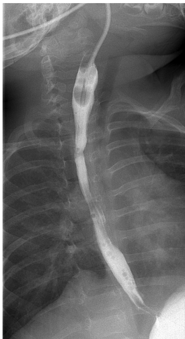
Figuur 3: Met röntgen contrastvloeistof onderzoeken we de slokdarm

slechter gaan drinken, gaan spugen, slijm opgeven of minder lucht krijgen. De vernauwing kunnen we in beeld brengen met röntgen contrastvloeistof, zie figuur 3. Een vernauwing kunnen we onder narcose oprekken. Dit is soms meerdere keren en op verschillende momenten in de toekomst nodig. Voor het oprekken gebruiken we meestal speciale ballonnen. Bij terugkerende vernauwingen kunnen we de ballon in de slokdarm achterlaten. De ballon kan dan in de thuissituatie meerdere keren per dag worden opgeblazen, om zo een terugkeer van de vernauwing te voorkomen.