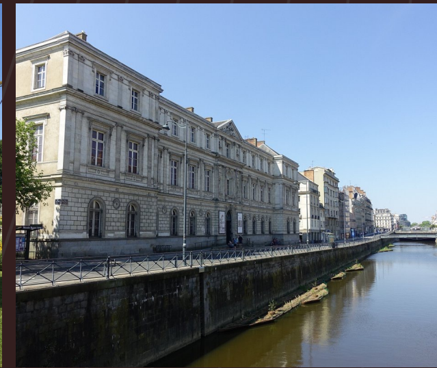
MUSEO DELLE BELLE ARTI (MUSÉE DES BEAUX-ARTS)

PER GLI AMANTI DELL'ARTE, QUESTO MUSEO È UNA TAPPA IMPERDIBILE. OSPITA UNA VASTA COLLEZIONE DI OPERE D'ARTE CHE SPAZIANO DAL XIV AL XX SECOLO, CON DIPINTI, SCULTURE E ALTRE OPERE D'ARTE CHE RAPPRESENTANO LA RICCA STORIA ARTISTICA DELLA REGIONE.