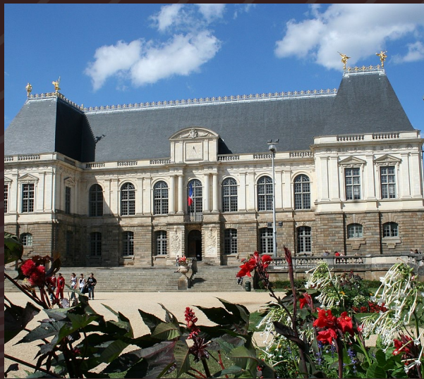
PARLAMENTO DI BRETAGNA (PARLEMENT DE BRETAGNE)

QUESTO IMPONENTE EDIFICIO È UNO DEI SIMBOLI STORICI DI RENNES. COSTRUITO NEL XVII SECOLO, IL PARLAMENTO DI BRETAGNA È UN CAPOLAVORO ARCHITETTONICO CON UNA FACCIATA RICCAMENTE DECORATA. OGGI, È UTILIZZATO COME CORTE D'APPELLO, MA È POSSIBILE AMMIRARE LA SUA BELLEZZA ESTERNA MENTRE PASSEGGI PER LA PIAZZA ANTISTANTE.