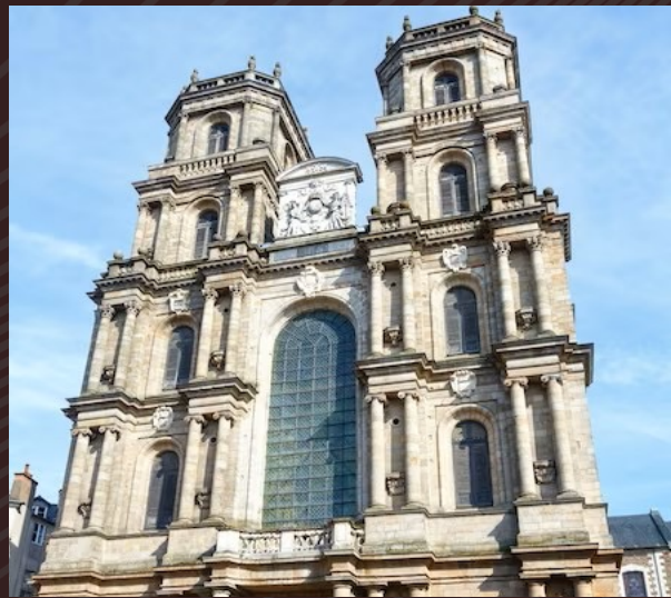
CATTEDRALE DI SAINT-PIERRE

QUESTA CATTEDRALE GOTICA RISALE AL XII SECOLO ED È UN'ALTRA GEMMA ARCHITETTONICA DI RENNES. LA SUA FACCIATA DECORATA E LE IMPONENTI VETRATE SONO IMPRESSIONANTI. L'INTERNO DELLA CATTEDRALE È ALTRETTANTO AFFASCINANTE, CON OPERE D'ARTE E DETTAGLI ARCHITETTONICI CHE RACCONTANO SECOLI DI STORIA.