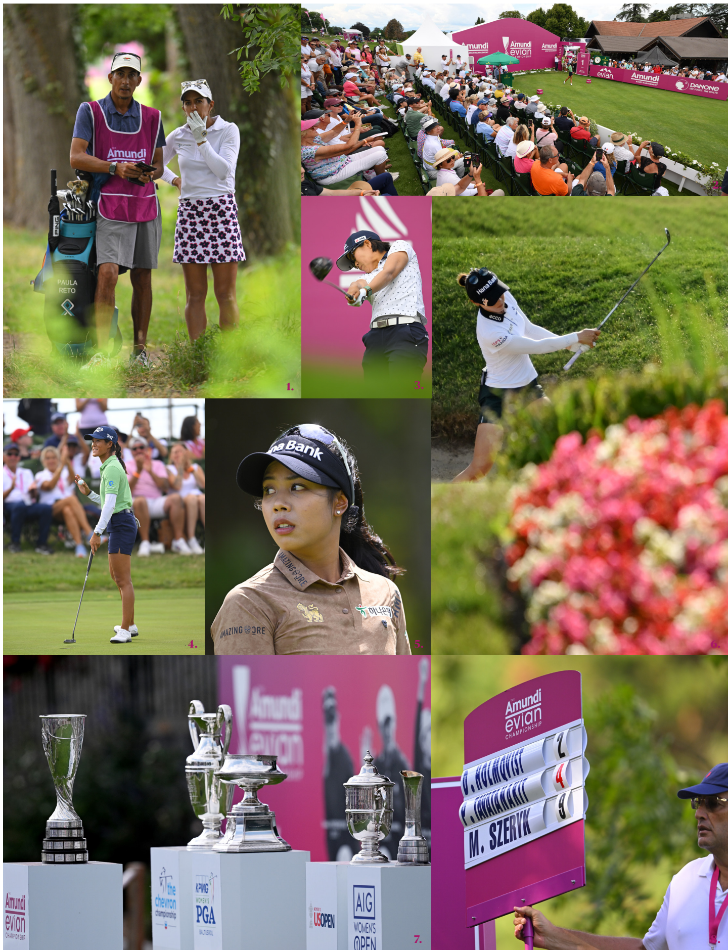
1. Paula Reto et son caddy / Paula Reto and her caddy 2. Dans les tribunes du trou n°1 / In the stands at hole 1 3. Nasa Hataoka 4. Céline Boutier : dernier birdie au 18 e / Céline Boutier : last birdie at the 18 th hole 5. Patty Tavatanakit 6. Lydia Ko 7. Les trophées des 5 Majeurs féminins / The trophies of the five women's Majors 8. Un commissaire au cœur de la compétition / A marshal at the heart of the tournament.