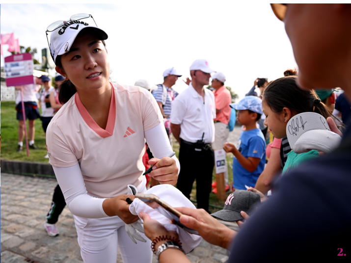
Focus sur les championnes et leurs fans / Champions & fans 1. Brooke M. Henderson 2. Rose Zhang