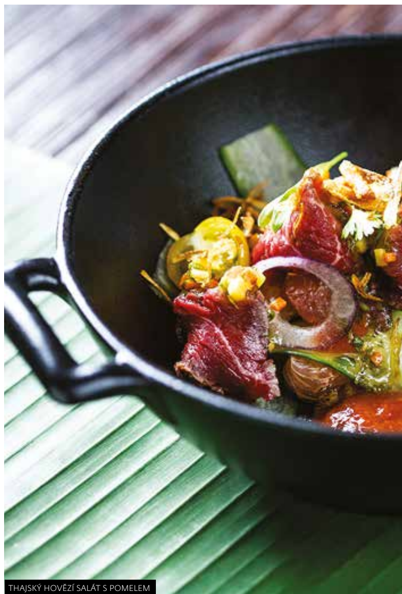
THAJSKÝ HOVĚZÍ SALÁT S POMELEM

Pečené kachní prso servírované s batátovým pyré a krocketou z kachních stehen pečených na pekingský způsob s foie gras. Základem omáčky je kachní demi glase, který se vaří s omáčkou hoisin a lanýží, které se v omáčce na závěr rozmixují.