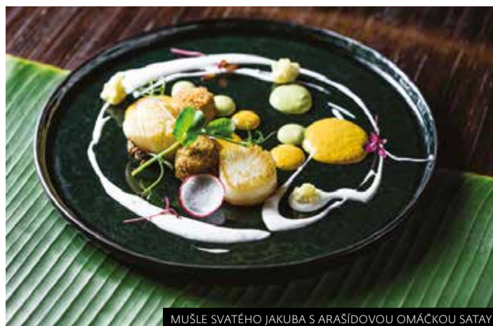
MUŠLE SVATÉHO JAKUBA S ARAŠÍDOVOU OMÁČKOU SATAY