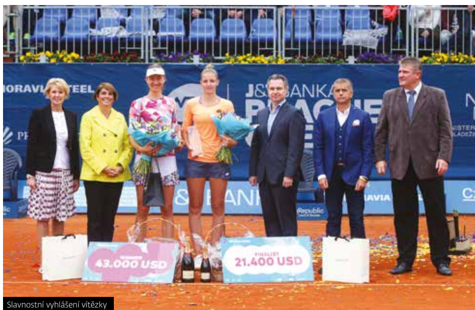
Slavnostní vyhlášení vítězky