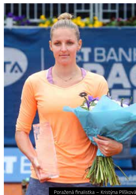
Poražená finalistka – Kristýna Plíšková