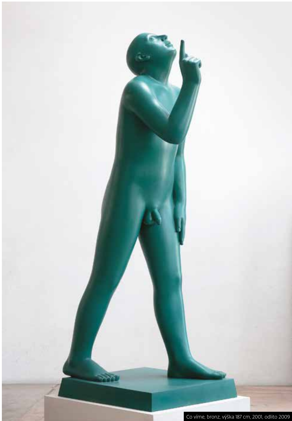
Co víme, bronz, výška 187 cm, 2001, odlito 2009

Jiří Středa hledá inspiraci pro své sochy všude kolem sebe, ale hlavně v sobě. Jeho díla si můžete aktuálně prohlédnout v brněnské J&T Banka Café Trinity.