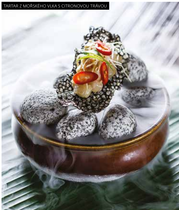
TARTAR Z MOŘSKÉHO VLKA S CITRONOVOU TRÁVOU

Nový studený pokrm je prvním průkopníkem nové sekce česká fúze, v níž jde o prolnutí českých tradičních receptů s asijskou kuchyní. Pstruh je marinovaný v dresinku z bezových květů s yuzu, vařeným bílým chřestem, melounem galia a čerstvým jablkem. Tento tepelně neupravený pstruh vás překvapí svou delikátní chutí a svěžestí.