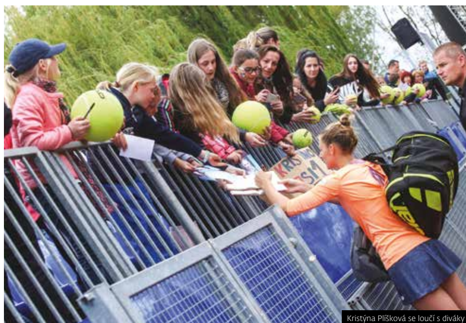
Kristýna Plíšková se loučí s diváky