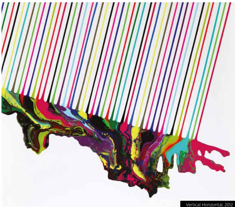
Vertical Horizontal, 2012