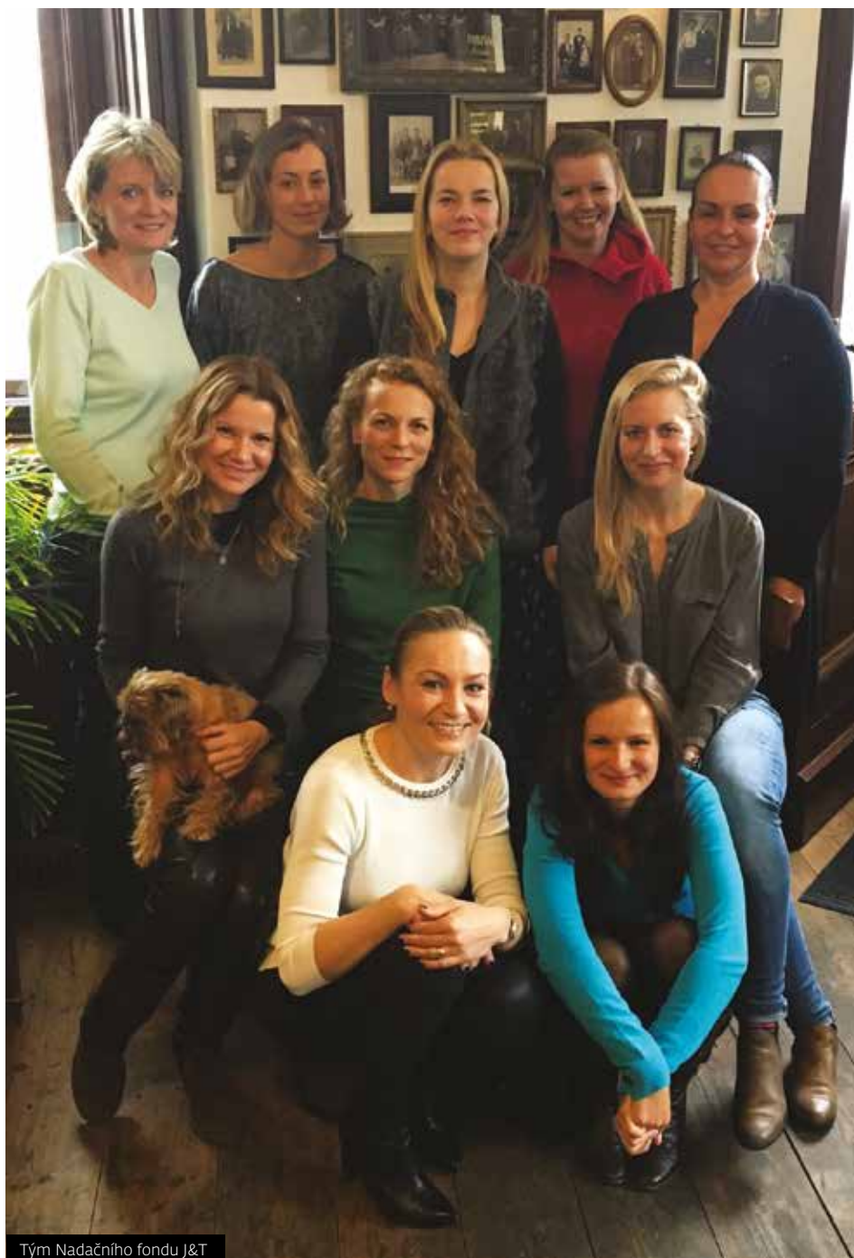
Tým Nadačního fondu J&T

Zájemci mohou využít poradnu na webových stránkách www.hledamerodice.cz , bezplatnou telefonní linku 800 888 245 nebo facebookový profil Hledáme rodiče: Pěstouny. V současné době odpovídáme v průměru na 2 až 3 cílené dotazy denně. Nejčastěji se žadatelé ptají na postup a podmínky podání žádosti o pěstounskou péči, na rozdíly mezi jednotlivými typy náhradní rodinné péče, na finanční zajištění a zda lze mít limitující požadavky na dítě. Zajímají se také o to, zda existuje nějaká věková hranice u ženy-pěstounky nebo jestli musí být pár ve svazku manželském.