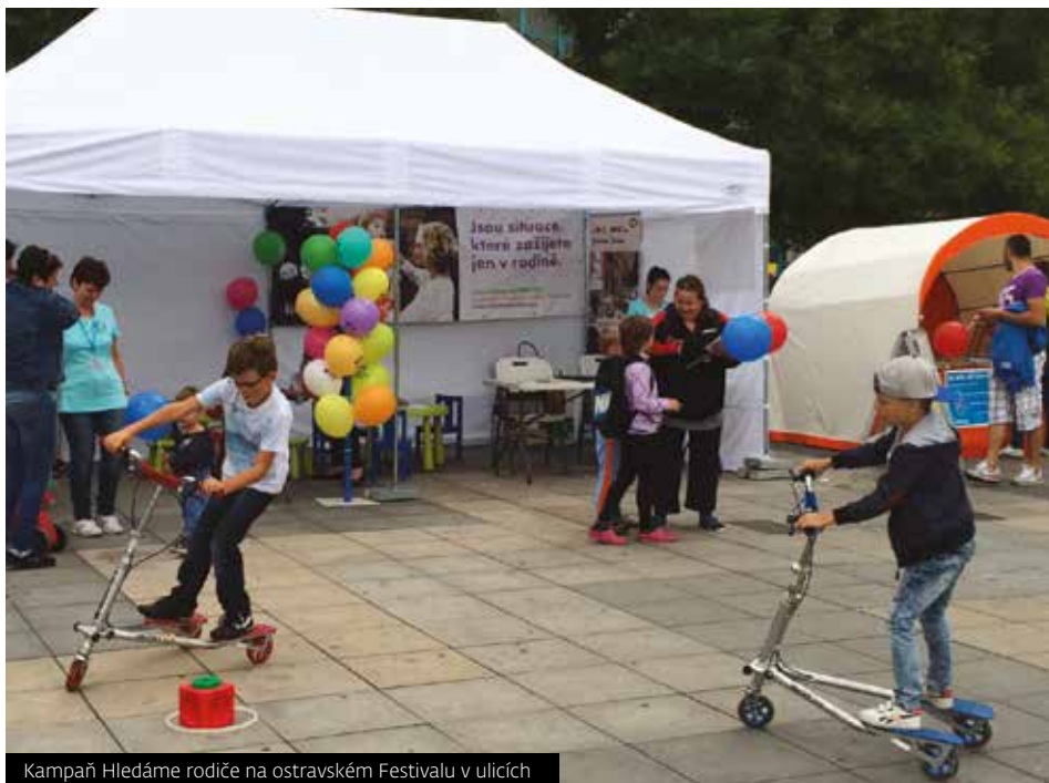
Kampaň Hledáme rodiče na ostravském Festivalu v ulicích