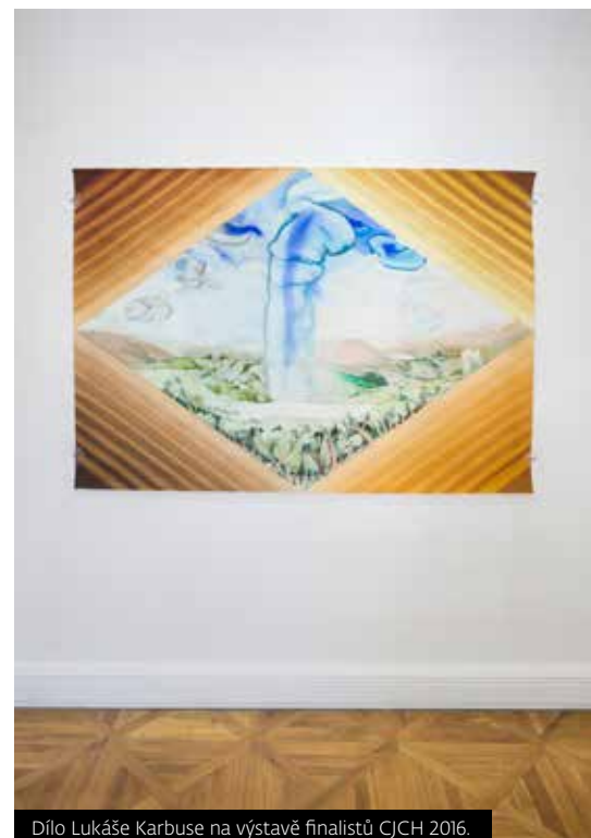
Dílo Lukáše Karbuse na výstavě finalistů CJCH 2016.

Domnívám se, že vzdělání v humanitních oborech obecně je především o schopnosti naučit se otevřeně a kriticky uvažovat o světě, ve kterém žijeme, najít si v něm své místo, být tvůrčí, orientovat se v tom, co se odehrává nyní i v historických sou-