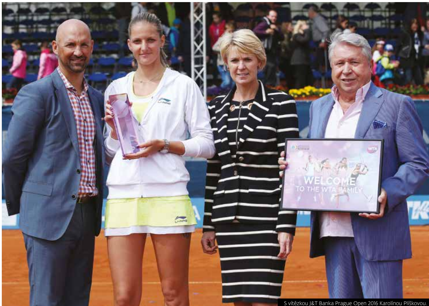
S vítězkou J&amp;T Banka Prague Open 2016 Karolínou Plíškovou.

bezlepková a bezlaktózová dieta. Věříte těmhle věcem, že mají podíl na úspěchu?