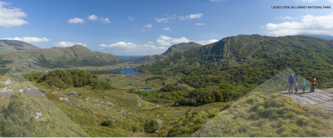
LADIES VIEW, KILLARNEY NATIONAL PARK