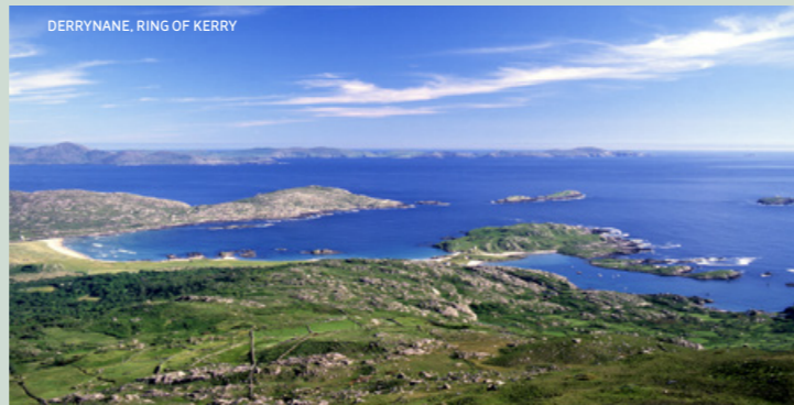
DERRYNANE, RING OF KERRY