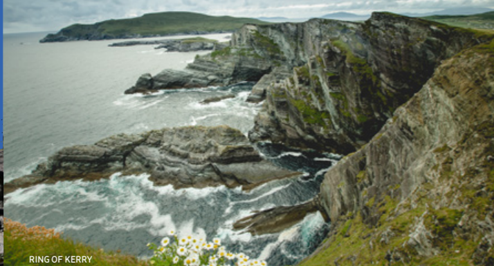
RING OF KERRY