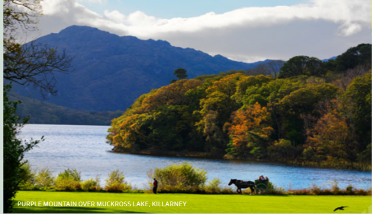
PURPLE MOUNTAIN OVER MUCKROSS LAKE, KILLARNEY

Visitantes contiene una exposición multilingüe, una presentación audiovisual, un ferrocarril modelo Kerry y una zona de observación de aves.