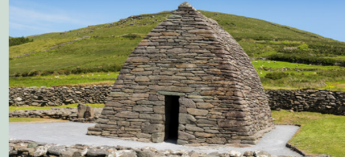
LEMON ROCK BIKE TOURS