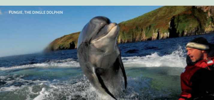
FUNGIE, THE DINGLE DOLPHIN