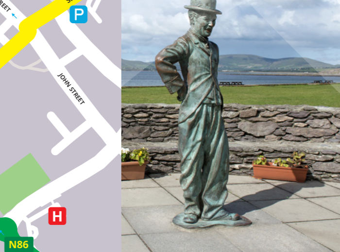
CHARLIE CHAPLIN STATUE, WATERVILLE