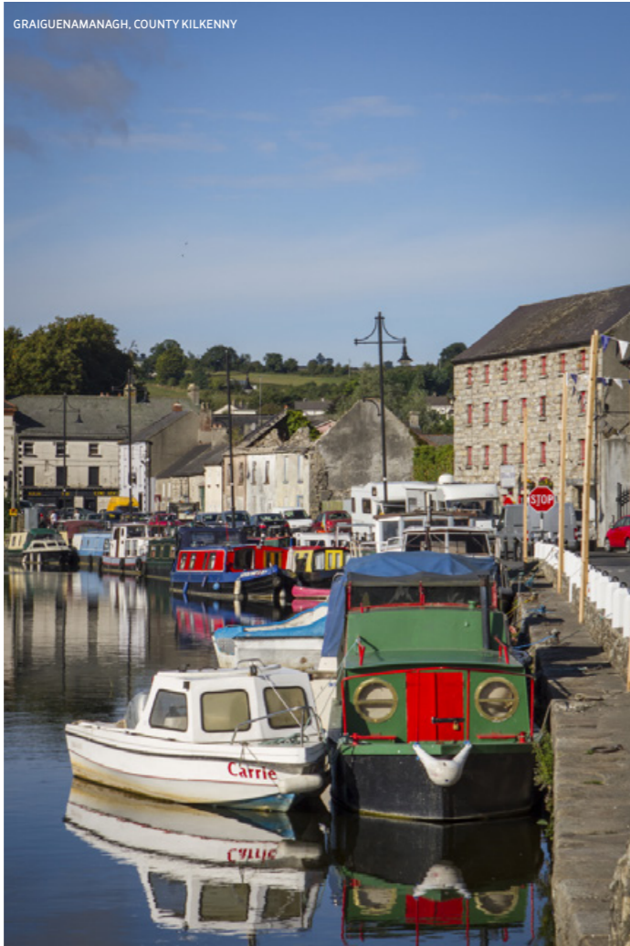
GRAIGUEENAMANAGH, COUNTY KILKENNY

DUISKE ABBEY Monumento nazionale, l'abbazia di Duiske è nata nel XIII secolo come chiesa di un monastero cistercense. È situata a Graigueenamanagh, nella Contea di Kilkenny.