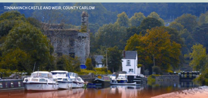
TINNAHINCH CASTLE AND WEIR, COUNTY CARLOW

FI-10724-TCWKK-ITA-0419 Mappa © Fáilte Ireland 2018. Fáilte Ireland declina ogni responsabilità per eventuali errori od omissioni contenute in questa mappa. Design della mappa www.speeddesign.ie. Dati cartografici originali originati nel marzo 2018 © OpenStreetMap.org. Per feedback, si prega di contattare - visitors@failteireland.ie