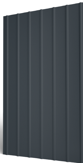
Tabla cutată W10 cu profil trapezoidal este disponibilă în trei dimensiuni pe lățime, 1150 mm, 920 mm, respectiv 870 mm. Cu înălțimea cutei de 10 mm, tabla cutată W10 poate fi folosită la lucrări de placare pe suport continuu. Este ideală pentru proiecte industriale, la exteriorul respectiv interiorul construcțiilor, pereți și diverse aplicații cu rol estetic, cât și a zonelor de sageac ale acoperișurilor.