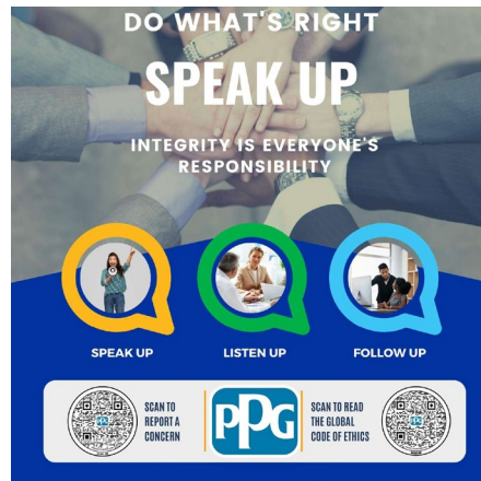
Speak Up 포스터