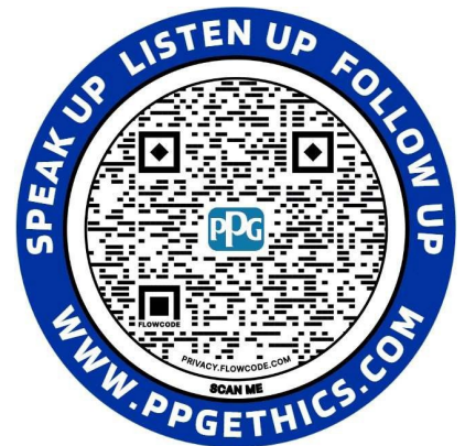
윤리 헬프 라인 스티커

이러한 자료는 PPG의 기업 윤리 및 규정 준수 웨어포인트 사이트를 통해 주문할 수 있습니다.