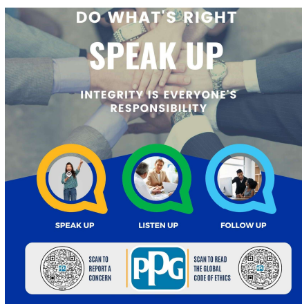
Afișul Speak asistență