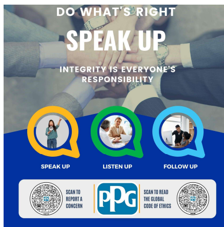
Speak Up Poster