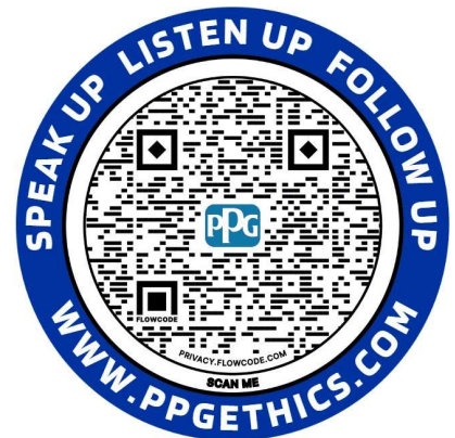
Ethische Hulplijn Sticker

U kunt deze materialen bestellen in je eigen taal via de SharePoint-site Ethics and Compliance van PPG.