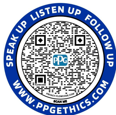
hjälp linje Klistermär ke

Du kan beställa dessa material via PPG:s SharePoint-webbplats för etik och efterlevnad.