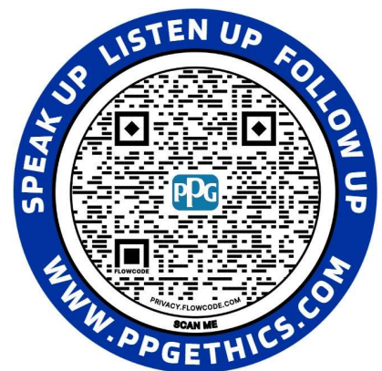
Etisk hjælpelinje Klistermærk

Du kan bestille disse materialer via PPG's SharePoint-site for etik og compliance.