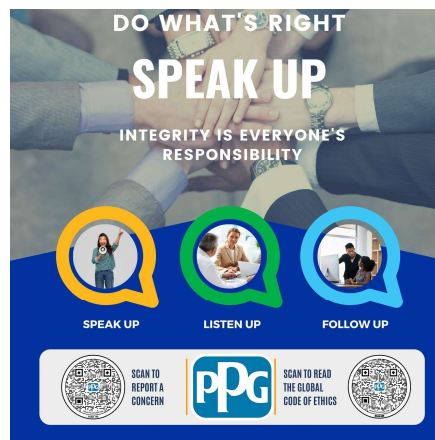
Speak Up Plakat