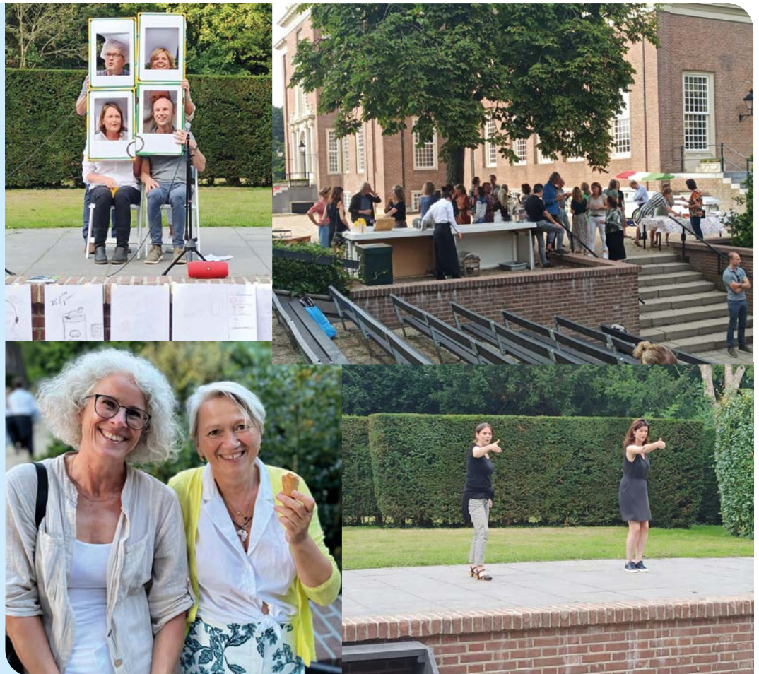
Een sfeerimpresie van het feest Van het Slot, 9 september 2021

In maart 2021 zijn wij van start gaan met de weekstart. Een weekstart is één van de instrumenten van het UMC-brede project 'Samen voor de Patiënt' om binnen UMC Utrecht een continu verbeteren-cultuur te realiseren. Het is een korte, effectieve teamsessie van maximaal 30 minuten waarin een (multidisciplinair) team wekelijks resultaten bespreekt en doelen bepaalt. Door terug- en vooruitkijken inventariseren medewerkers samen knelpunten met als doel om continu (kort cyclisch) te verbeteren. De weekstart wordt op dit moment ingezet bij de ondersteuning en bij het managementteam. Het is de bedoeling de weekstart verder uit te rollen binnen onze opleiding, zodat ook docenten de voordelen ervan kunnen ervaren.